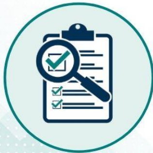
Ön Değerlendir me